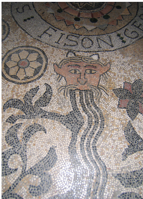
Détail de la mosaïque des 4 fleuves