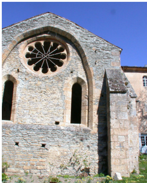
Abbaye Notre Dame de Valcroissant