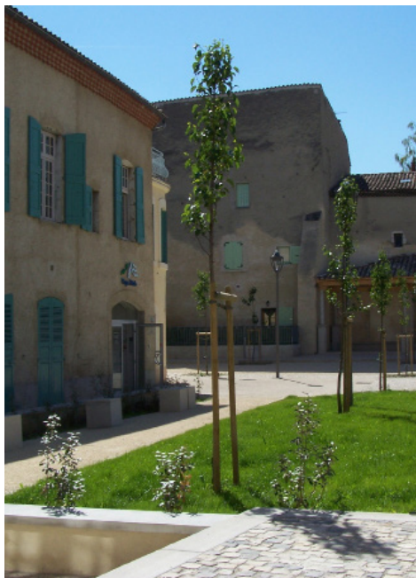
Place Jules Plan