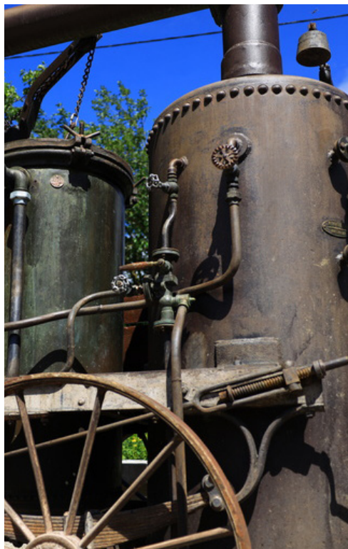
Ancien alambic de la Distillerie des 4 Vallées

302 chemin des Garandons Distillation à l'ancienne dans un alambic de 1900 et exposition d'alambics anciens