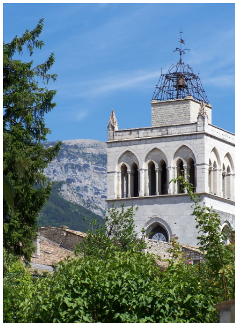
Cathédrale Notre Dame de Die