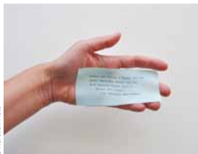
© Agnès Geoffray / Adagp. Paris / Jersey Heritage archives © Aurélien Mole

CONCERT au Train Théâtre Jeudi 7 novembre à 20h