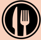
Table paysanne A pas d'âne